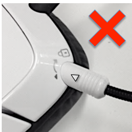
しっかりマイクが入っていない状態