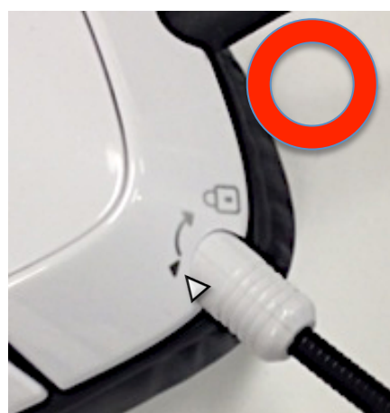
しっかりマイクが入っている状態